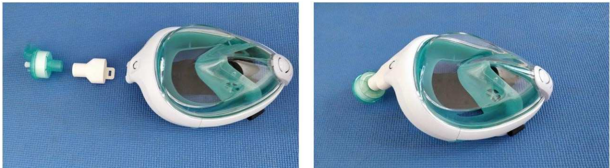
Figure 1. Composition de l'équipement PGE COVID-19: un masque de plongée EasyBreath v1 (Subea Decathlon), un adaptateur PGE-BIC-560, un filtre ISO 5356-1, diamètre 22mm (non fourni). A gauche: en 3 pièces détachées; à droite : le PGE COVID-19 assemblé

Le PGE COVID-19 ( Figure 1 ) est composé d'un masque de plongée avec 2 valves unidirectionnelles entre la chambre oculaire et la chambre buccale ainsi qu'une valve unidirectionnelle pour expirer la majorité de l'air au niveau du menton (modèle Décathlon Easybreath taille S/M et taille M/L), un adaptateur #PGE-BIC-560 ( Figure 2 ) qui relie le masque de plongée avec le filtre et un filtre antiviral bidirectionnel marqué CE approprié qui fournit une protection contre les agents pathogènes en suspension dans l'air. Le filtre bidirectionnel n'est pas fourni; voir la section «Sélection et utilisation de filtre approprié».